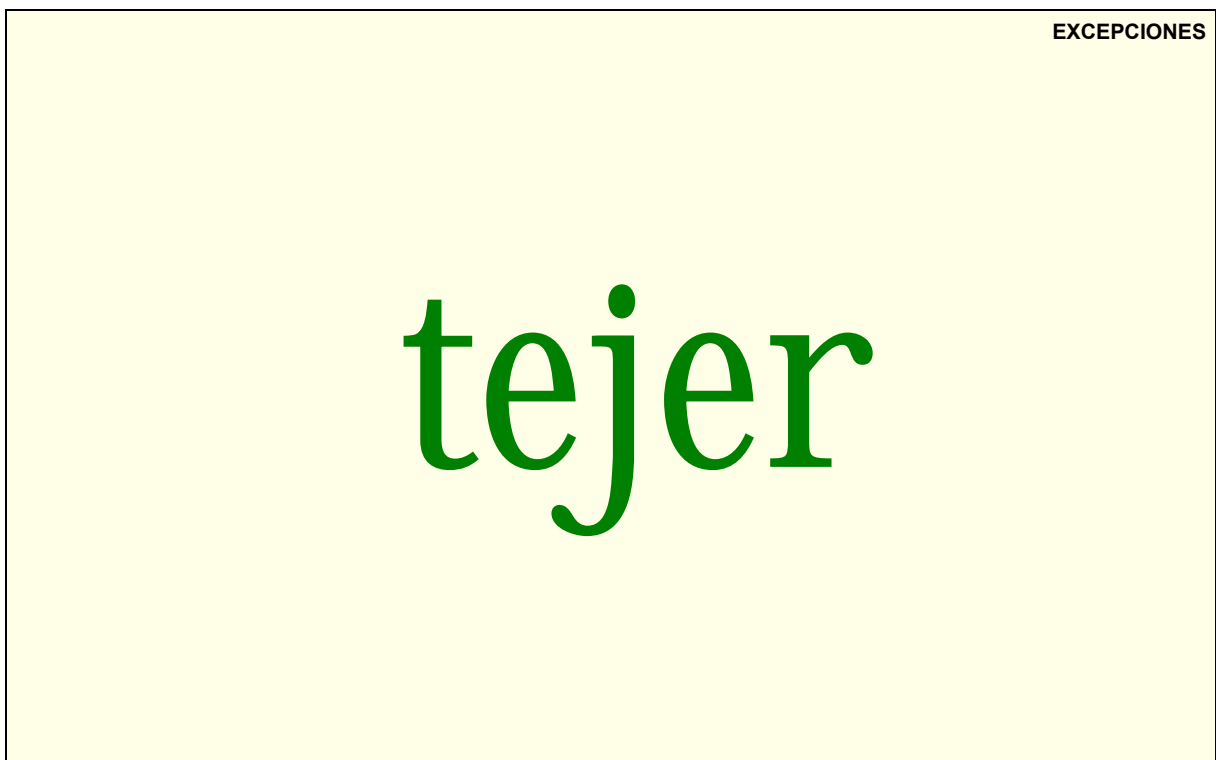
Ejemplo de una tarjeta de EXCEPCIONES.