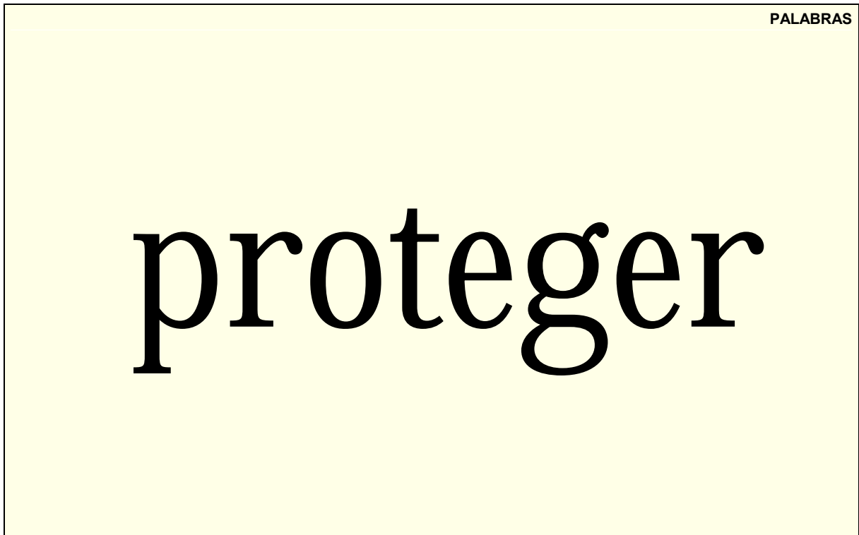
Ejemplo de una tarjeta de PALABRAS.